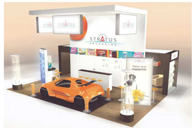
STRATUS PACKAGING HALL 6 STAND 6 C 105