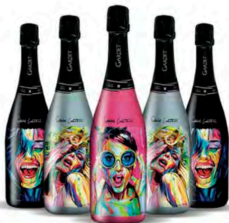
Concept : Cochet Concept Artiste : Raphaël Laventure / Ibiza